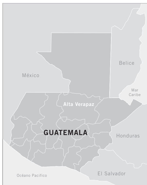
Mapa Guatemala: SEGEPLAN 2005

El Porvenir II es un caserío situado en el municipio de Chisec, departamento de Alta Verapaz, en el Norte de Guatemala.